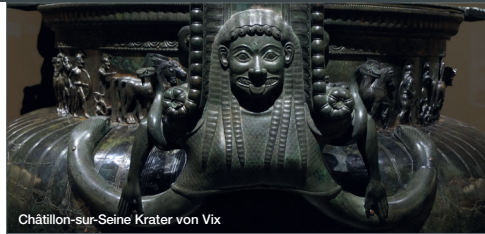
Châtillon-sur-Seine Krater von Vix

unsere Studienreise vom 30. September bis 3. Oktober 2017