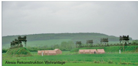
Alesia Rekonstruktion Wehranlage

unsere Studienreise vom 30. September bis 3. Oktober 2017